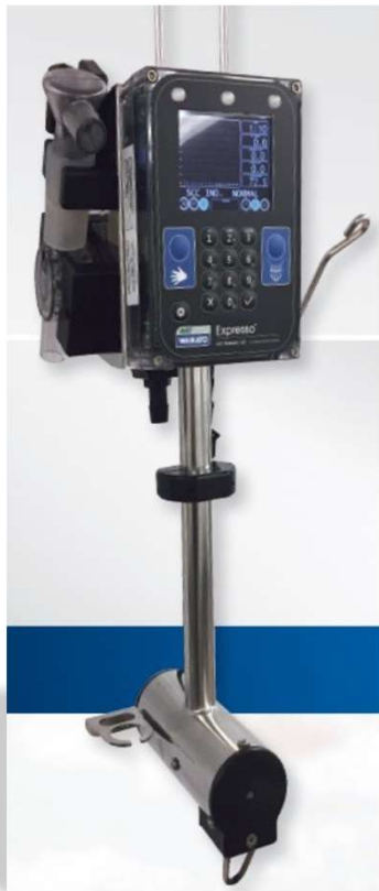
72560 タイストールパッケージ