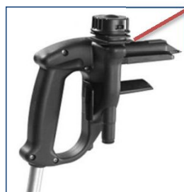
Fast Connect Glid