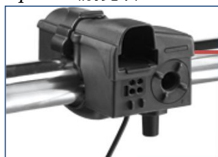
Fast Connect Stall Cock